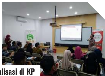
Sosialisasi di KP Jogjakarta