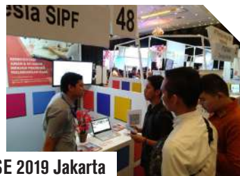
CMSE 2019 Jakarta