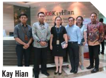
UOB Kay Hian