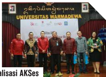
Sosialisasi AKSes di Bali