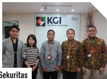
KGI Sekuritas Indonesia